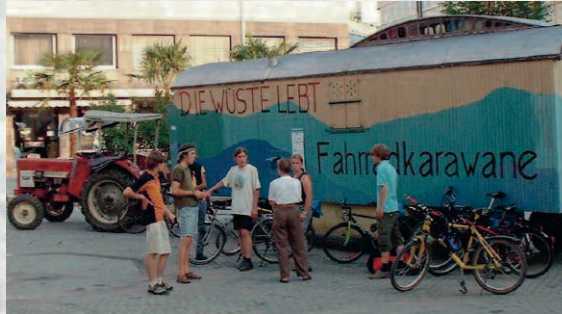
Umweltorientierte Fahrradtour duch Baden-Württemberg

Sie ist eine gemeinnützige rechtsfähige Stiftung des bürgerlichen Rechts und hat ihren Sitz in Stuttgart. Die Stiftung unterliegt der Stiftungsaufsicht durch das Regierungspräsidium Stuttgart als Stiftungsbehörde.