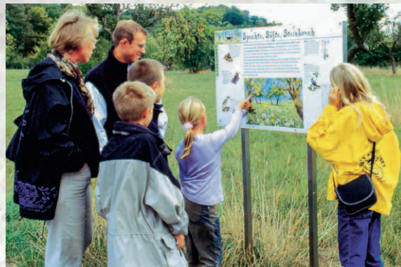
Naturerlebnispfad, Vogel- u. Naturschutzzentrum Sindelfingen

ist die Förderung von Maßnahmen auf dem Gebiet des Natur- und Umweltschutzes, der Landschaftspflege, der Umweltbildungsarbeit sowie die Unterstützung von Baumaßnahmen, welche der ökologischen und umweltgerechten Ausrichtung von Familienferien- und Wanderheimen dienen, insbesondere im Wirkungsgebiet der NaturFreunde Württemberg.