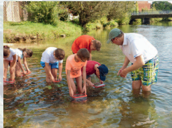
Umweltdetektive Mergelstetten – Bacherkundung

Aus Visionen wird Wirklichkeit — durch Ihre Spende!