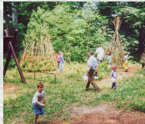
Erfahrungsfeld der Sinne, Stuttgart-Ost

Mit den Spenden und Erträgen des Stiftungsvermögens werden insbesondere unterstützt: