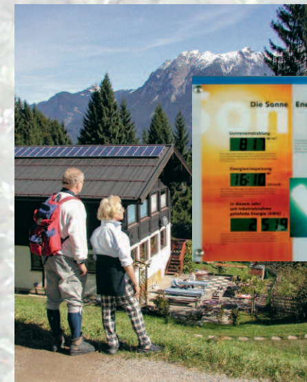
Familienferienheim Freibergsee mit Wärmerückgewinnungs- u. Photovoltaik-Anlage

ökologische Bauvorhaben in und an Familienferien- und Wanderheimen.