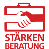
Unser Stärkenberater*innen Koffer-Kuchen :)

Gefördert durch das Bundesministerium des Innern, für Bau und Heimat im Rahmen des Bundesprogramms „Zusammenhalt durch Teilhabe“ Kofinanzierung durch die Landeszentrale für politische Bildung Baden-Württemberg im Rahmen des Landepprogramms „Demokratie stärken!“