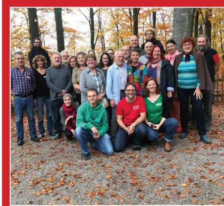
Stärkenberater*innen 2017-2019, NFH Lemberg

Anmeldung unter: NaturFreunde Württemberg Neue Straße 150, 70186 Stuttgart umwelt@naturfreunde-wuerttemberg.de Tel. 0711 481076