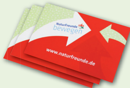
„NATURFREUNDE BEWEGEN“-AUFKLEBER 85 x 55 mm