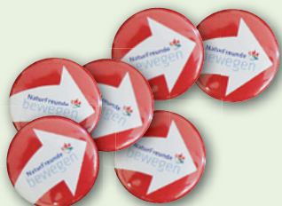
„NATURFREUNDE BEWEGEN“-BUTTONS Durchmesser 25 mm

→ Jetzt mit dem Anmeldeformular auf der Vorderseite kostenlos bestellen!