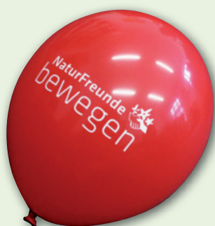
„NATURFREUNDE BEWEGEN“-LUFTBALLONS Natur-Latex, Höhe ca. 30 cm