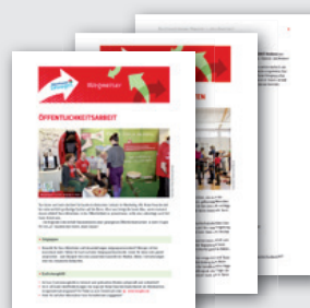
WEGWEISER ZU THEMEN DER VEREINSARBEIT DIN A4