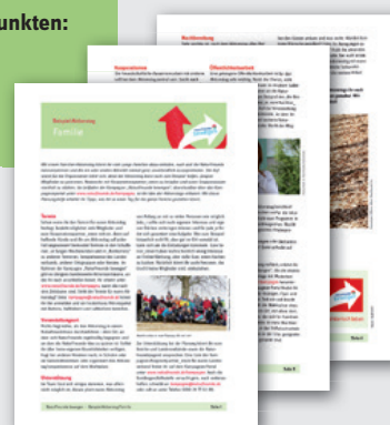
PLANUNGSHILFEN FÜR AKTIONSTAGE DIN A4